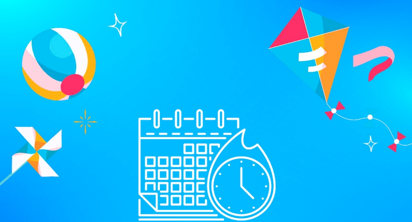
График выплат ИЮНЬ